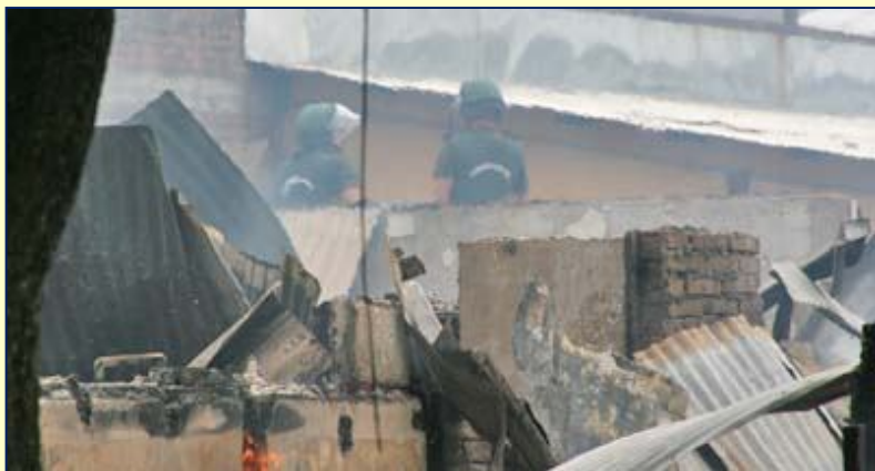
Cárcel de Chillán, tras la caída de un muro. Se fugaron más de 200 reos.