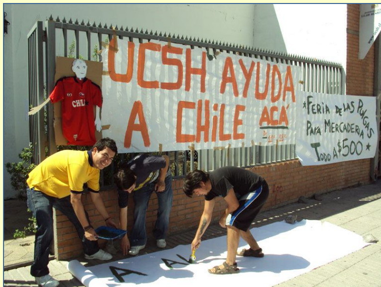
Comunidad Misionera de la UCSH www.ucsh.cl

Signo: Manos de colores que se pegan en la cruz y versículos bíblicos de esperanza que se entregan a la gente.