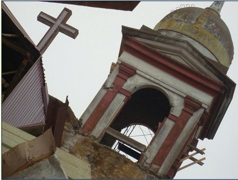
Iglesia María Auxiliadora, Linares