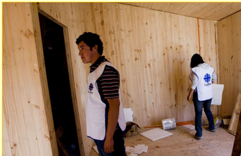
Construcción de viviendas en el Maule