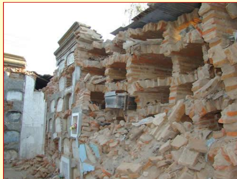
Cementerio de Curicó.

Jesús es bajado de la cruz y es puesto en el sepulcro