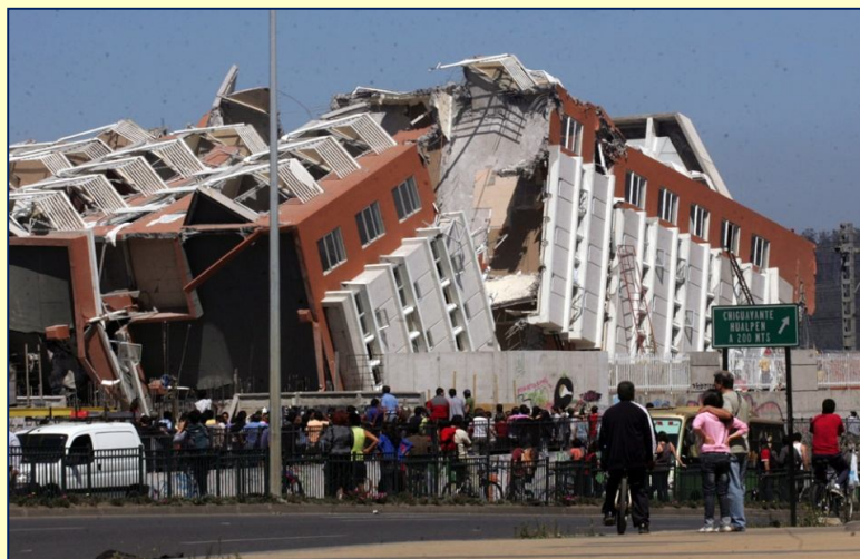
Zona Cero, Concepción

Jesús objeto de burlas camina hacia la crucifixión