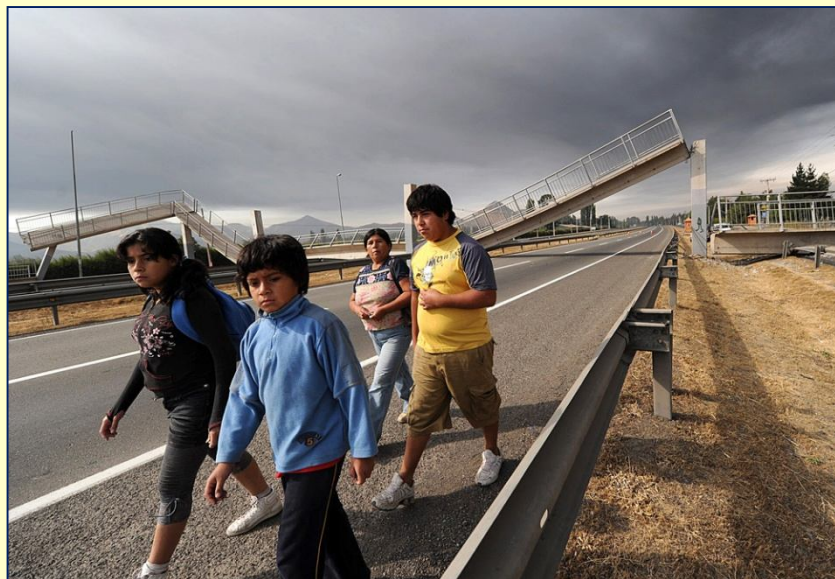
Pasarela de Santiago.