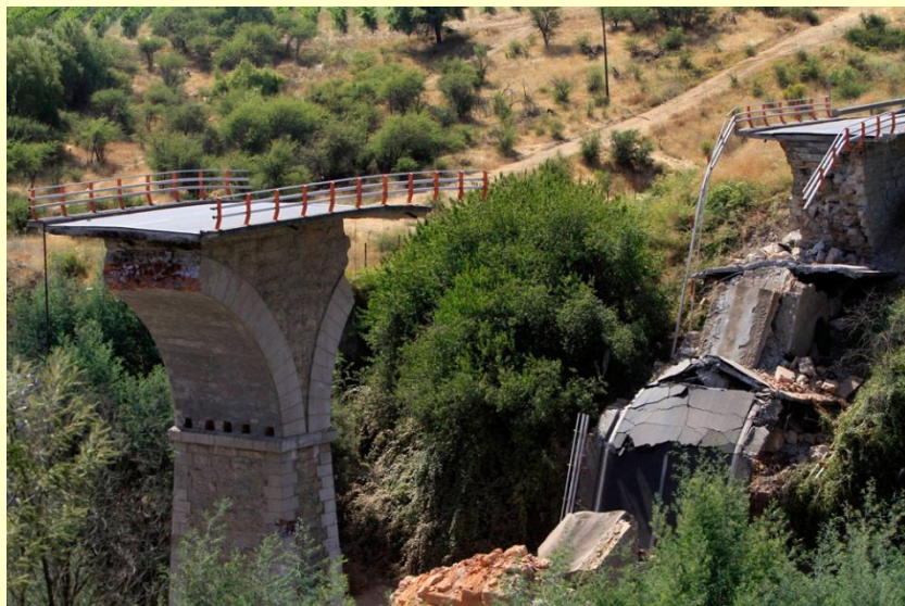
Puente próximo a la ciudad de Talca

Jesús es azotado, desvestido y coronado de espinas