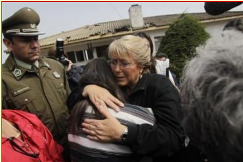
Ex presidenta de la República con algunas mujeres