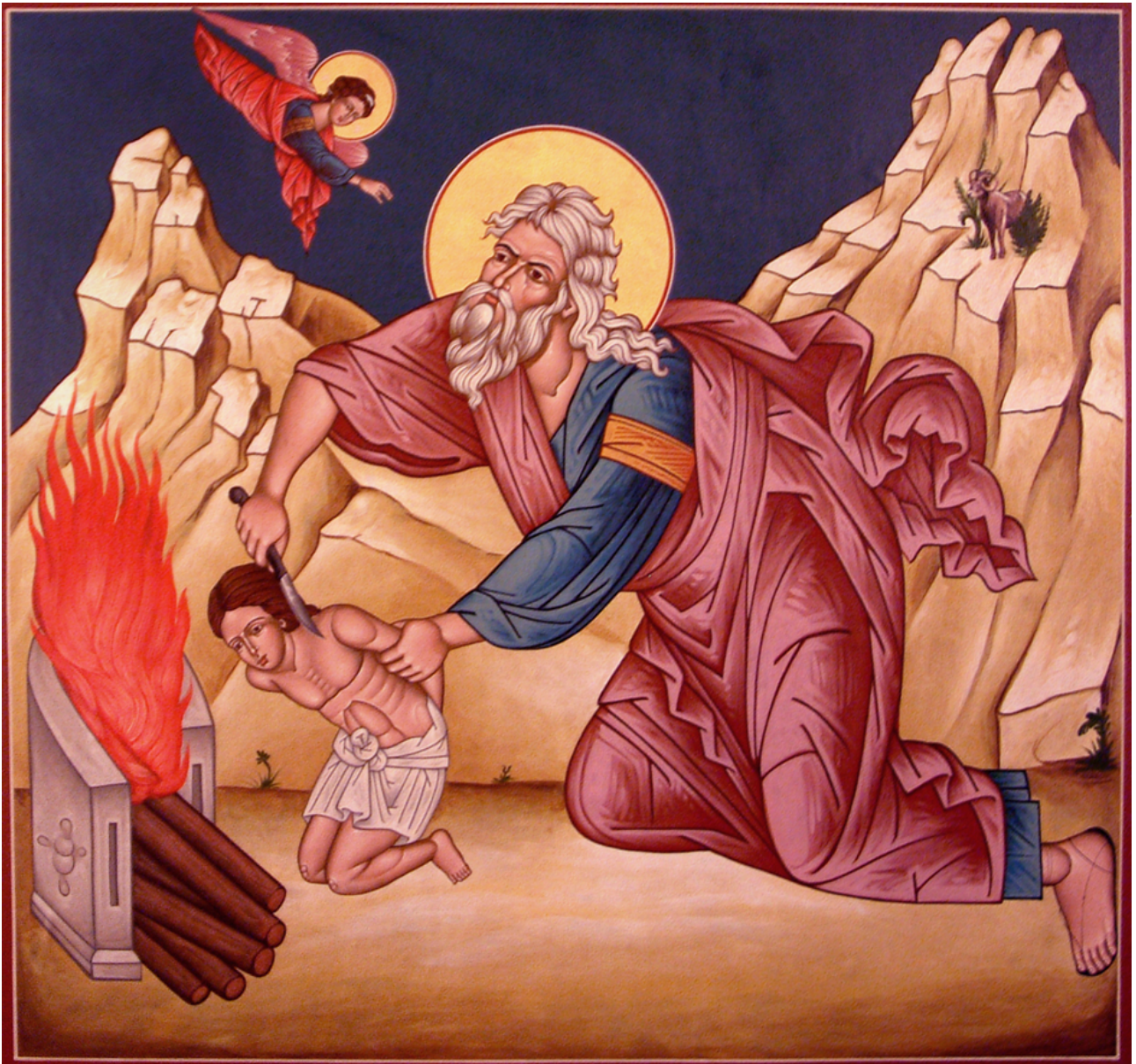
Abraham, sacrificio de Isaac, icono ortodoxo (South Glens Falls, NY)