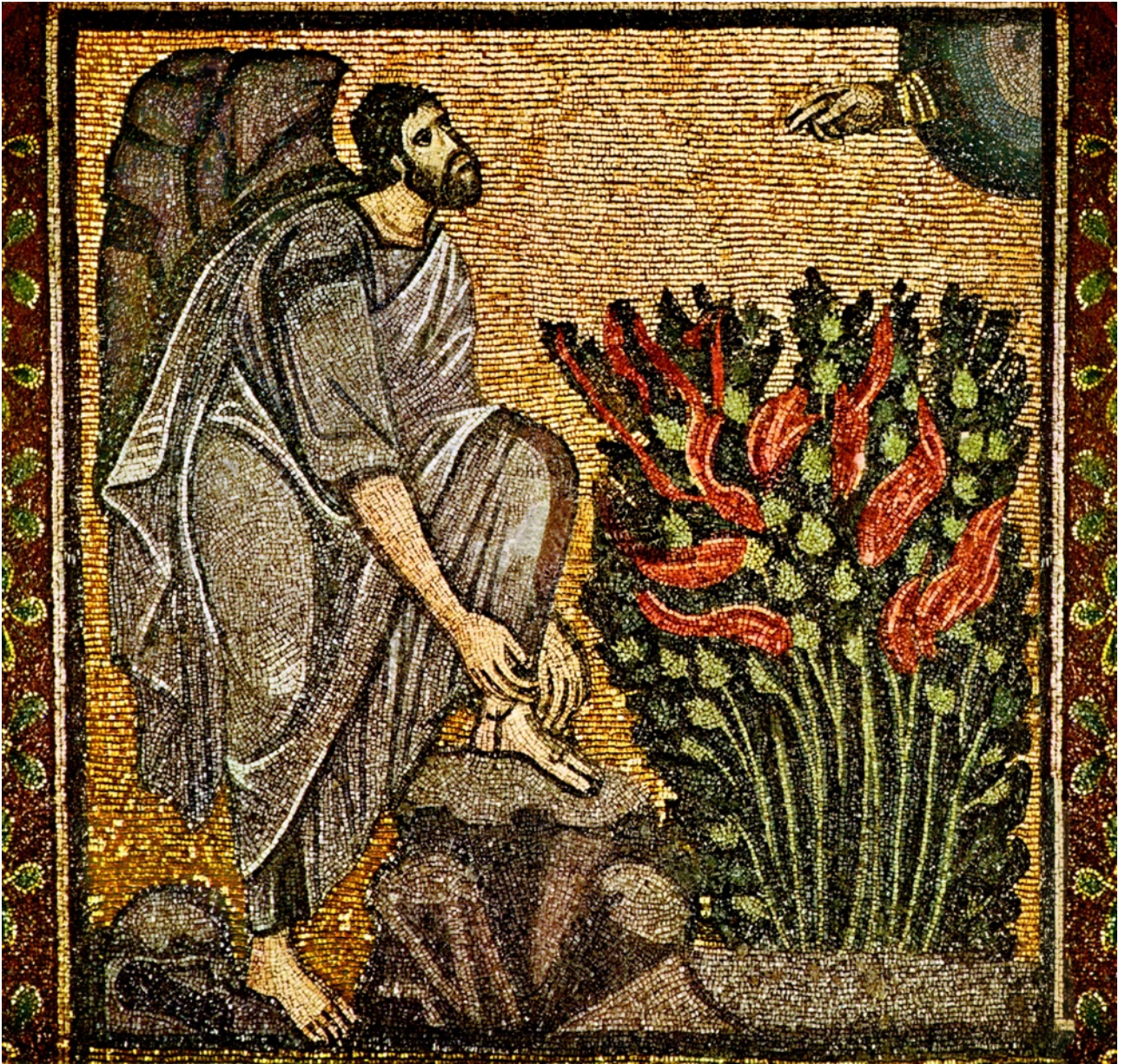
Moisés, la zarza ardiente (Mosaico Bizantino)