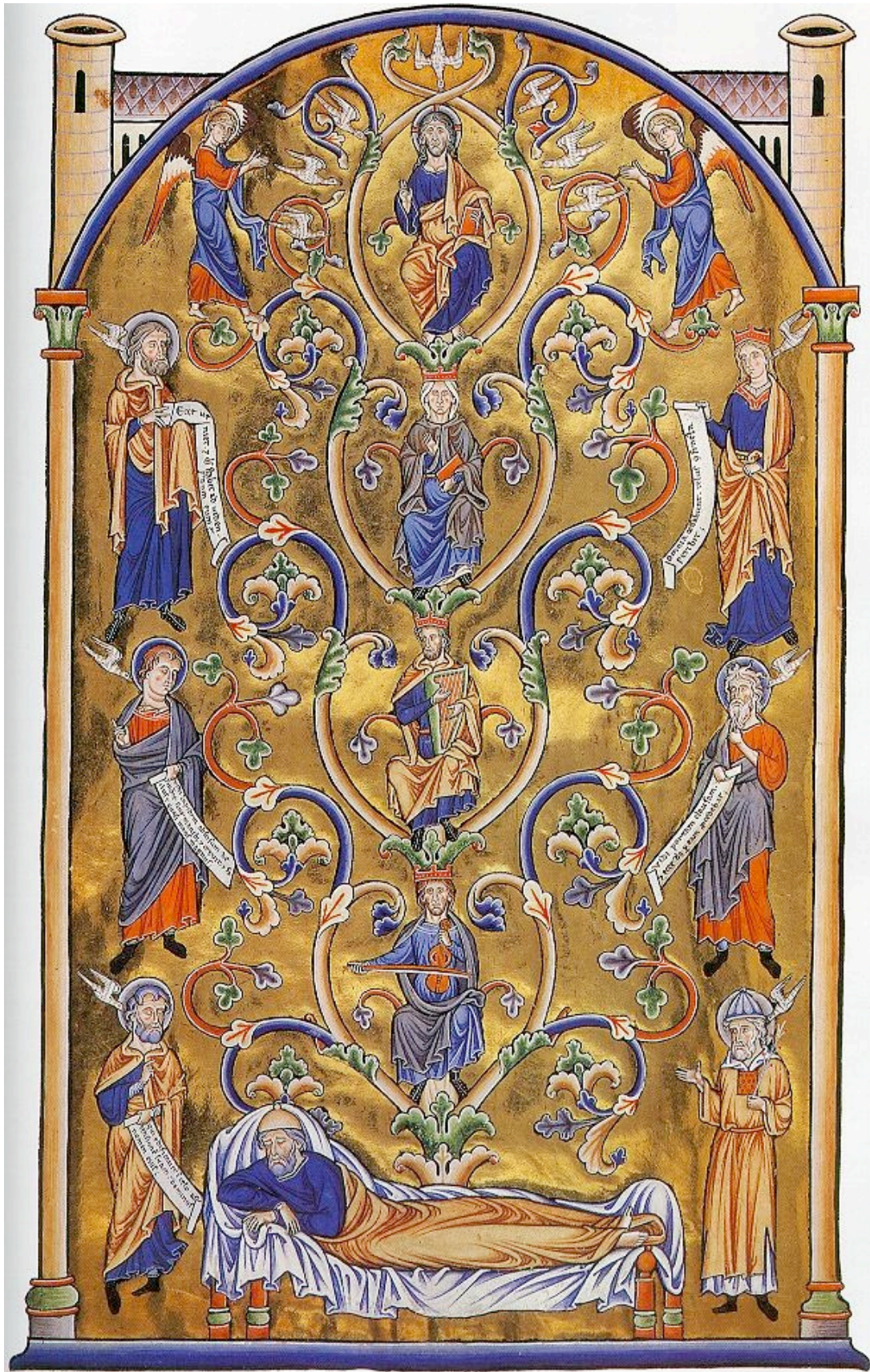
Icono del "Tronco de Jesé": David, Salomón, la Theotokos, rodeados por los profetas (s. XII)