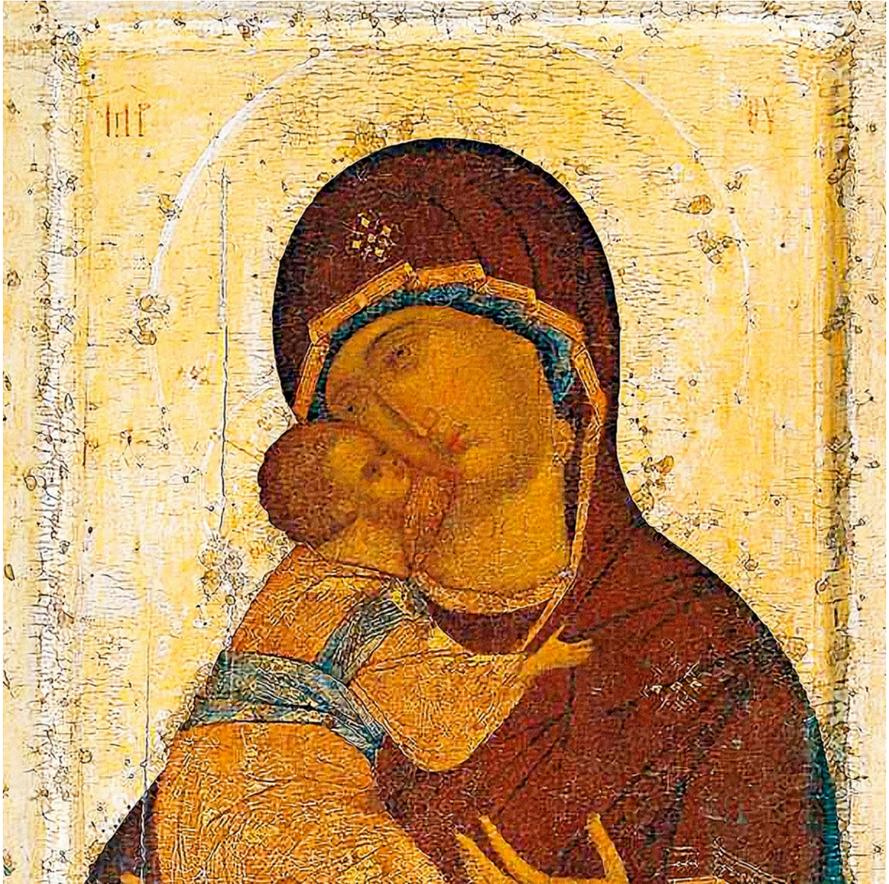
Virgen Theotokos de Vladimir (Icono Ruso)