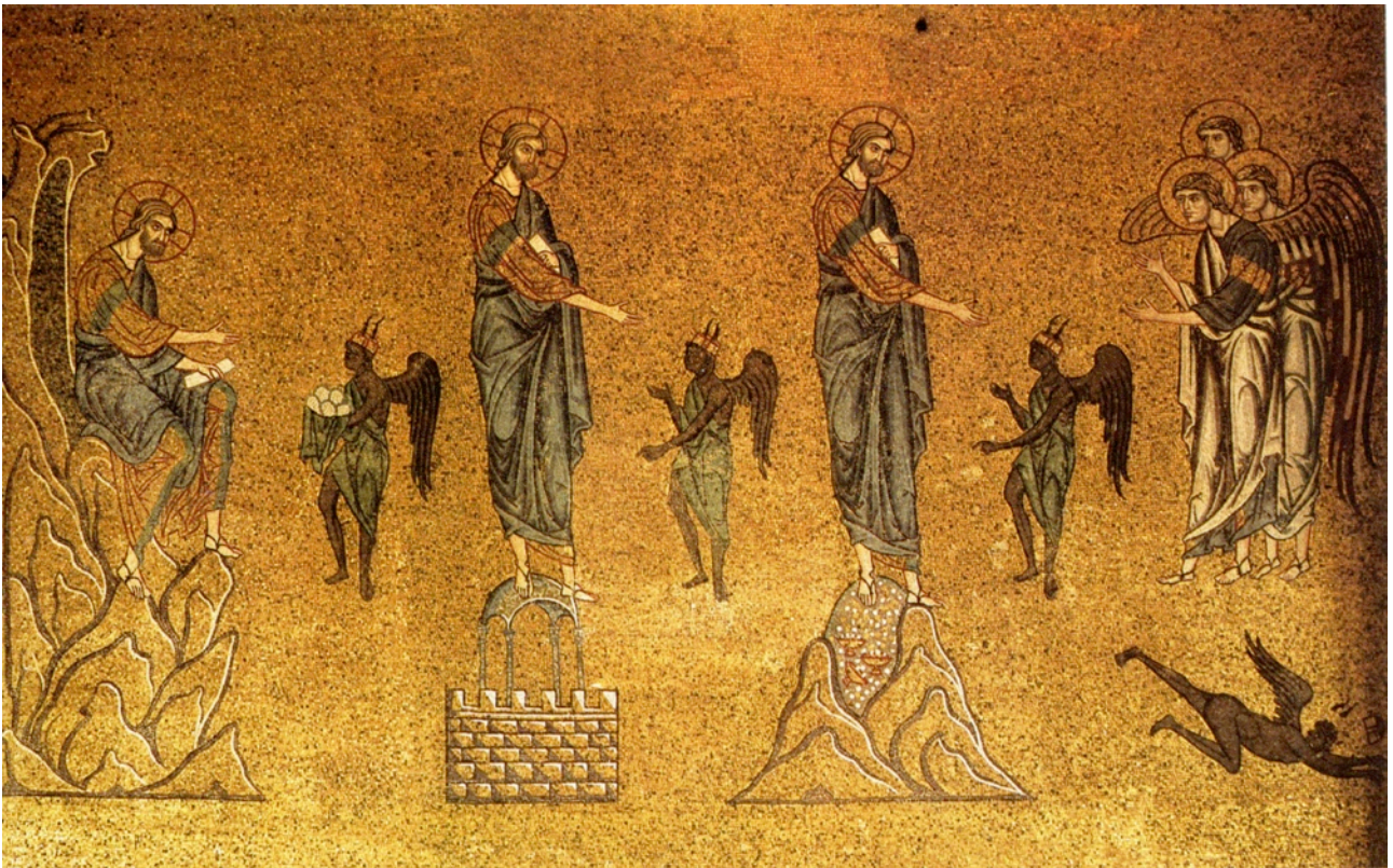
Las tres tentaciones de Jesús en el desierto (Mosaico Bizantino)