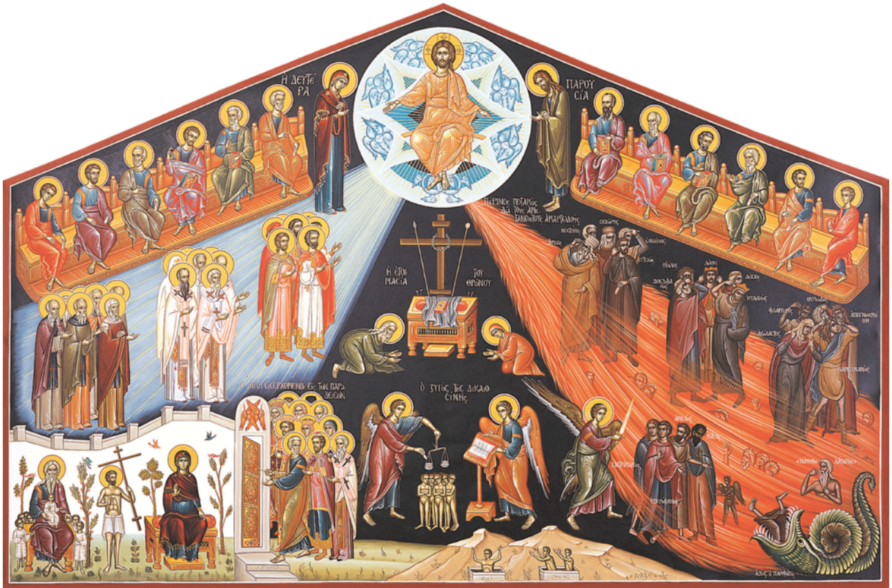
La Parusía (Icono Ortodoxo)