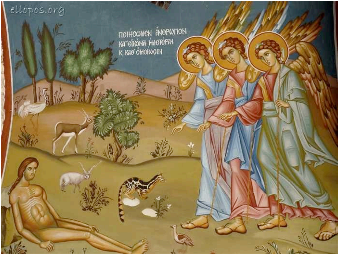
La creación, icono griego, Monasterio de san Macrino