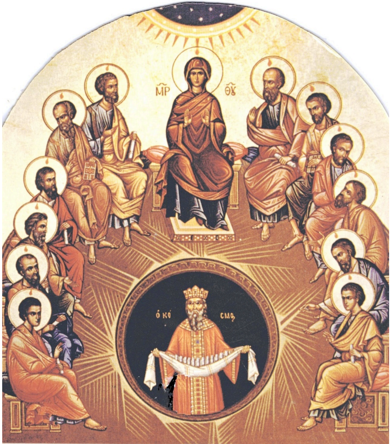
La Virgen María y los Apóstoles el día de Pentecostés