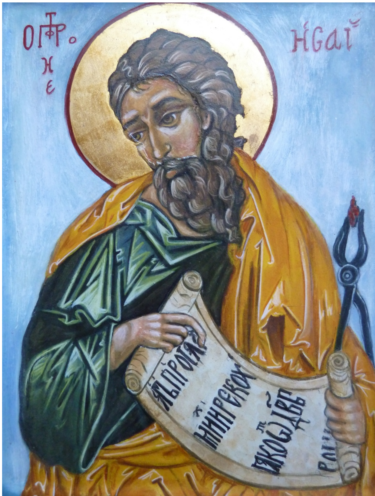
El Profeta Isaías