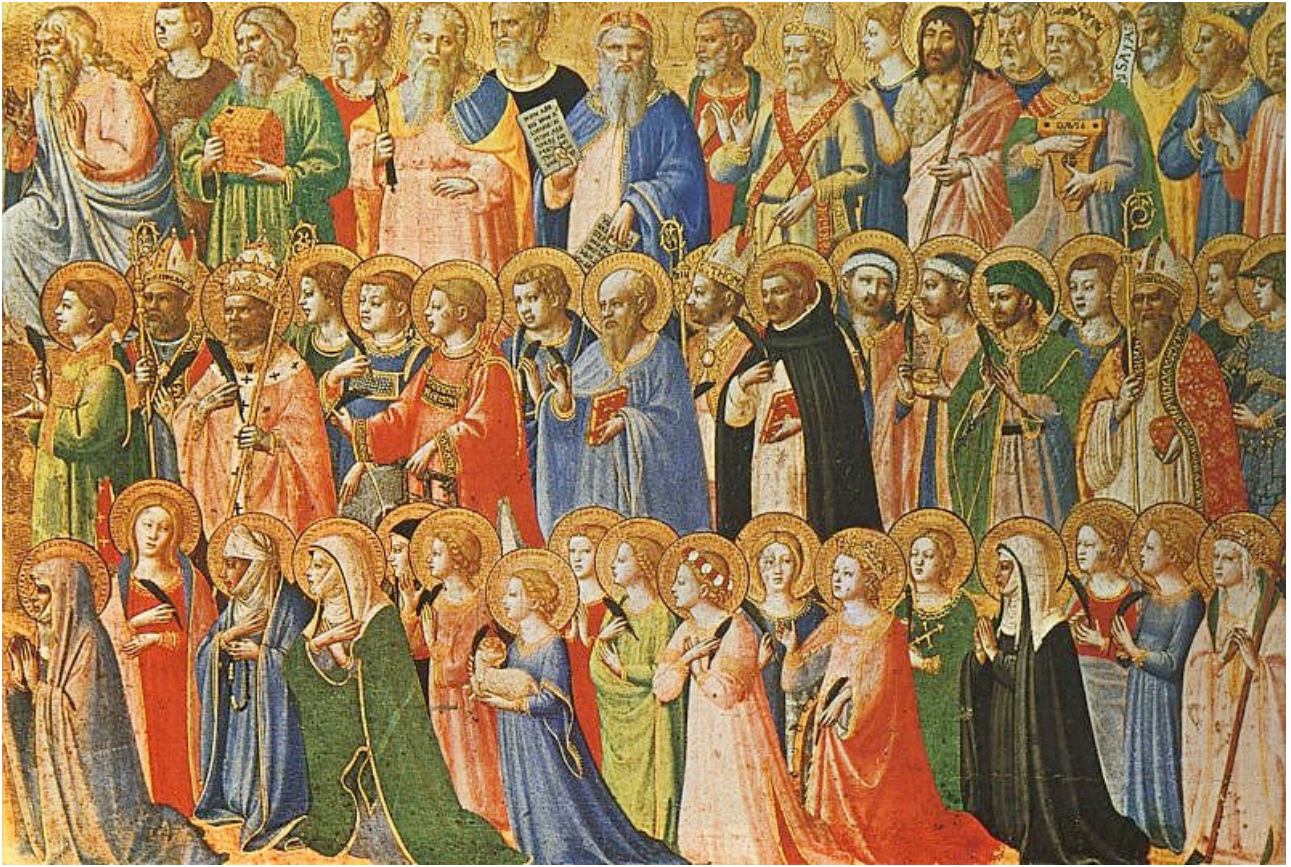
Todos los Santos, de Fra Angélico, s. XV