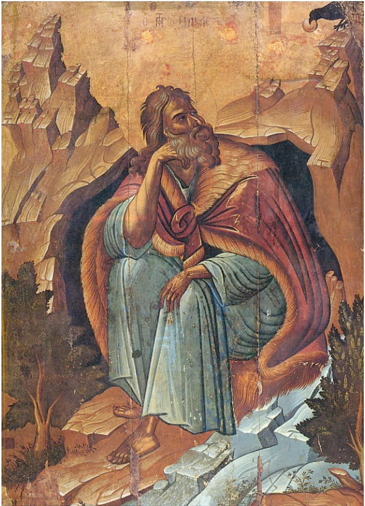
Elías profeta alimentado por los cuervos (icono ortodoxo)