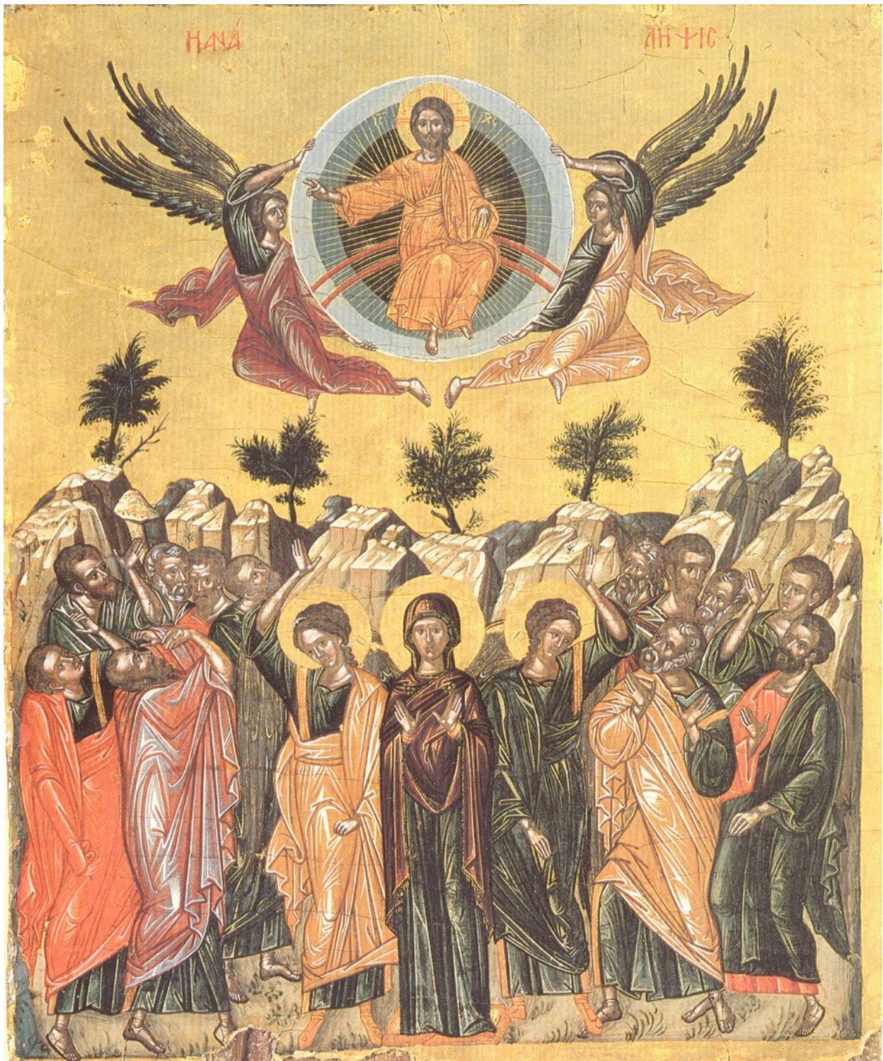
La Ascensión de Cristo (Icono Ortodoxo)