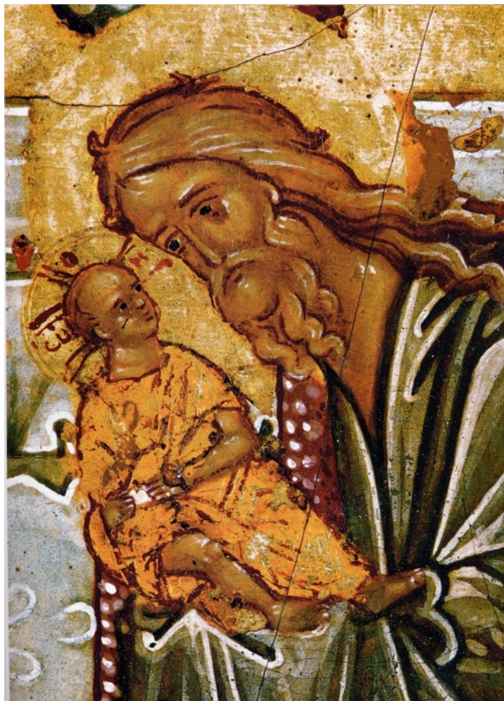
Presentación del Señor (detalle), Novgorod, s. XV

Encuentre más libros en http://www.cruzgloriosa.org/libros/