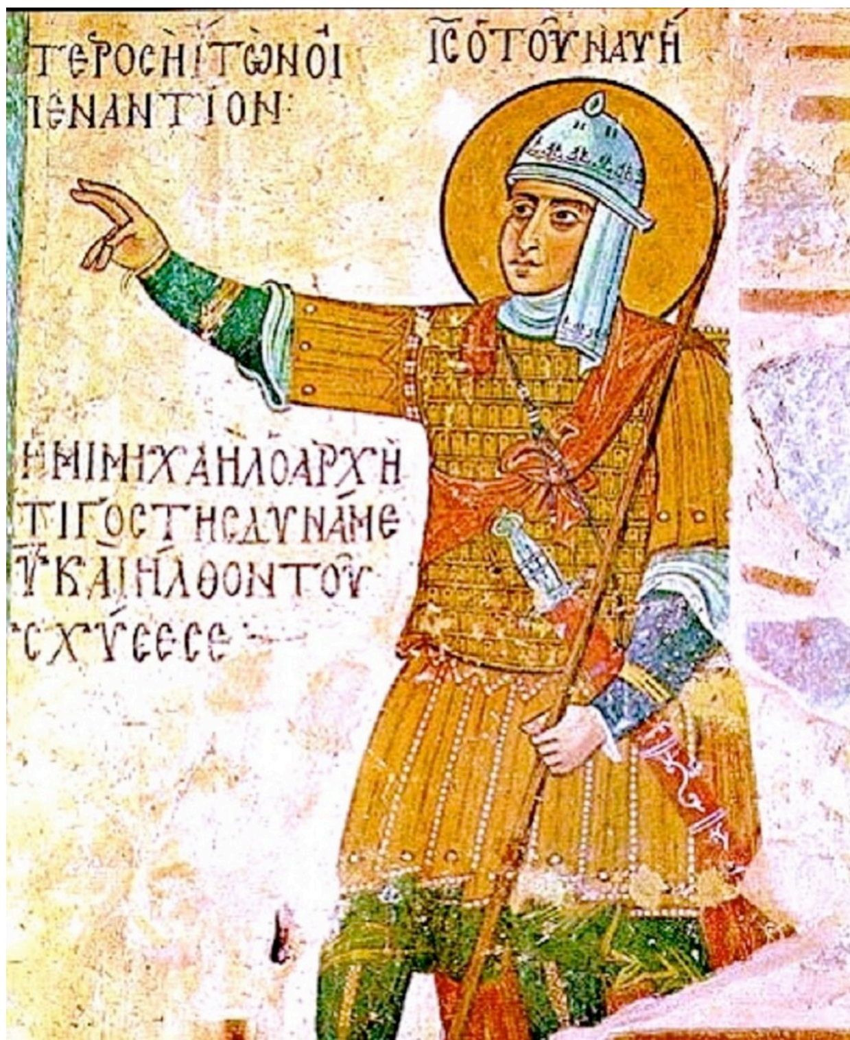
Josué, de Hosios Loukas (Icono Griego s. XII-XIII)