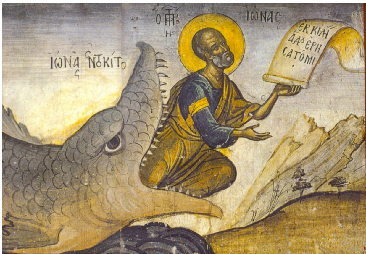
El Profeta Jonás en el vientre de la ballena