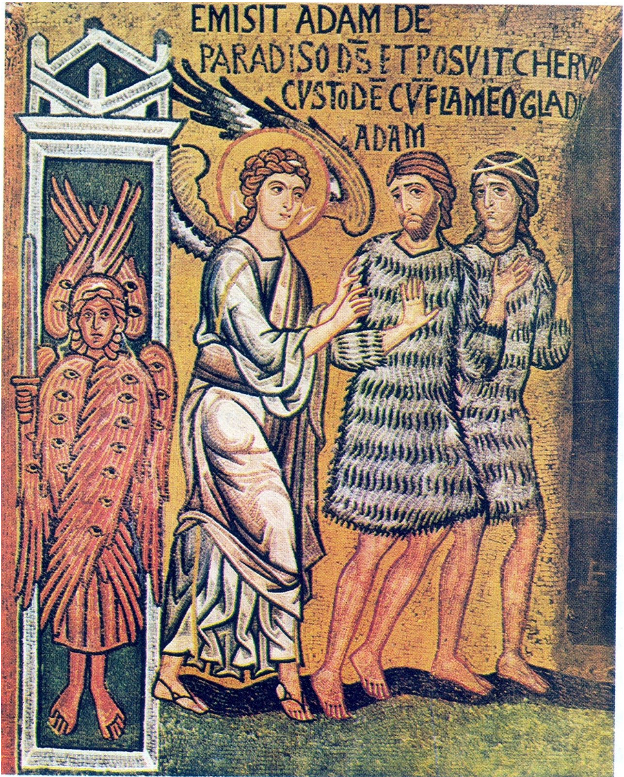
Expulsión del Paraíso, Palermo (Sicilia), s. XII